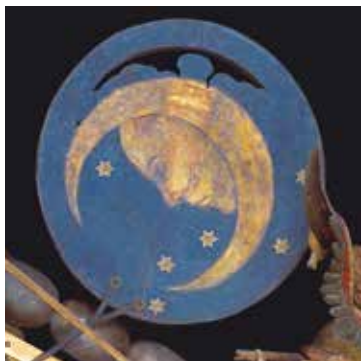
Engelsgruß von Veit Stoß (1517/1518), Detail der Rückseite.