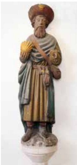
Darstellung des Hlg. Jakob.

Ursprünglich eine altfränkische Königskirche, dann Deutschordenskirche, immer eine Pilgerkirche auf dem Jakobsweg nach Santiago de Compostela zum Grab des Apostels Jakobus und mit großer Wahrscheinlichkeit auch die Begräbnisstätte des berühmten Tannhäuser. Eine wahrhaft historische Stätte, u. a. mit dem ältesten erhaltenen Hochaltar Nürnbergs um 1370 und Kunstwerken aus der Schule von Veit Stoß und Michael Wolgemut, dem Lehrer Albrecht Dürers. Bis heute ist sie für Pilger und die Menschen der Stadt ein Ort zur Rast und geistlichen Meditation.