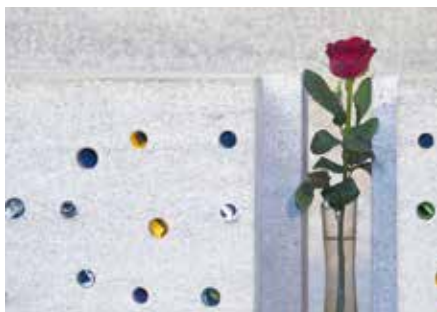
Trauerwand in der Klara-Kirche.

Erected 1270, the former Church of the Poor Clares is the site of the Catholic Counseling Services. In accordance with the official title "Open Church St. Clara", it attracts those without close church ties by offering a spiritual and cultural program which critically examines contemporary life. Although Catholic in character it is open for all, regardless of church or religious affiliation. Spiritual celebrations focus on life's turning points and crisis situations.