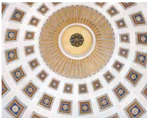
Innenansicht der Kuppel.

A quiet oasis on the edge of the pedestrian zone, which was once the chapel in the Hospital of the Order of Teutonic Knights. The Gothic building was removed in 1785 and the Neo-classical replacement not fully completed until 1902/3. The vastness of the heavens is discerned under the 50 meter high dome. Those seeking solitude are invited to climb down to the crypt.